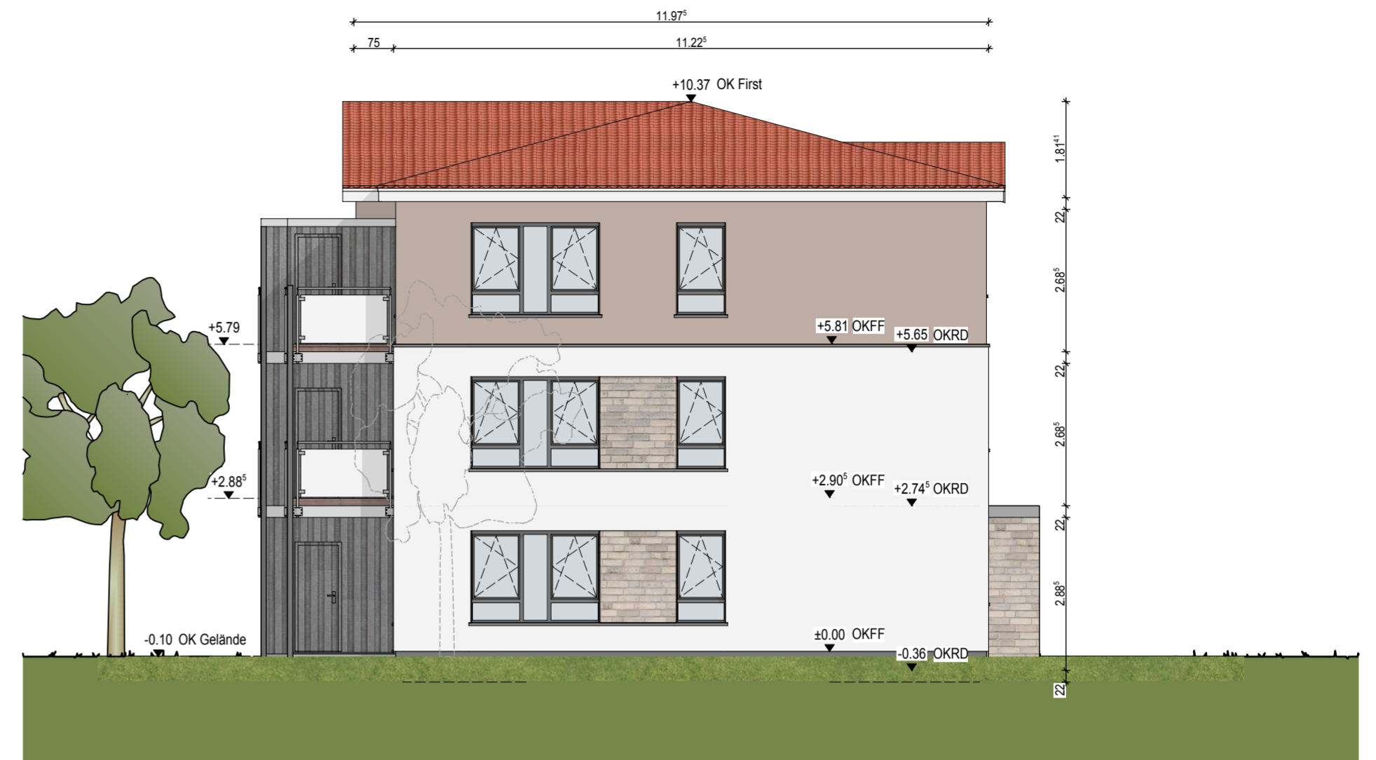
Ost-Ansicht Haus 4