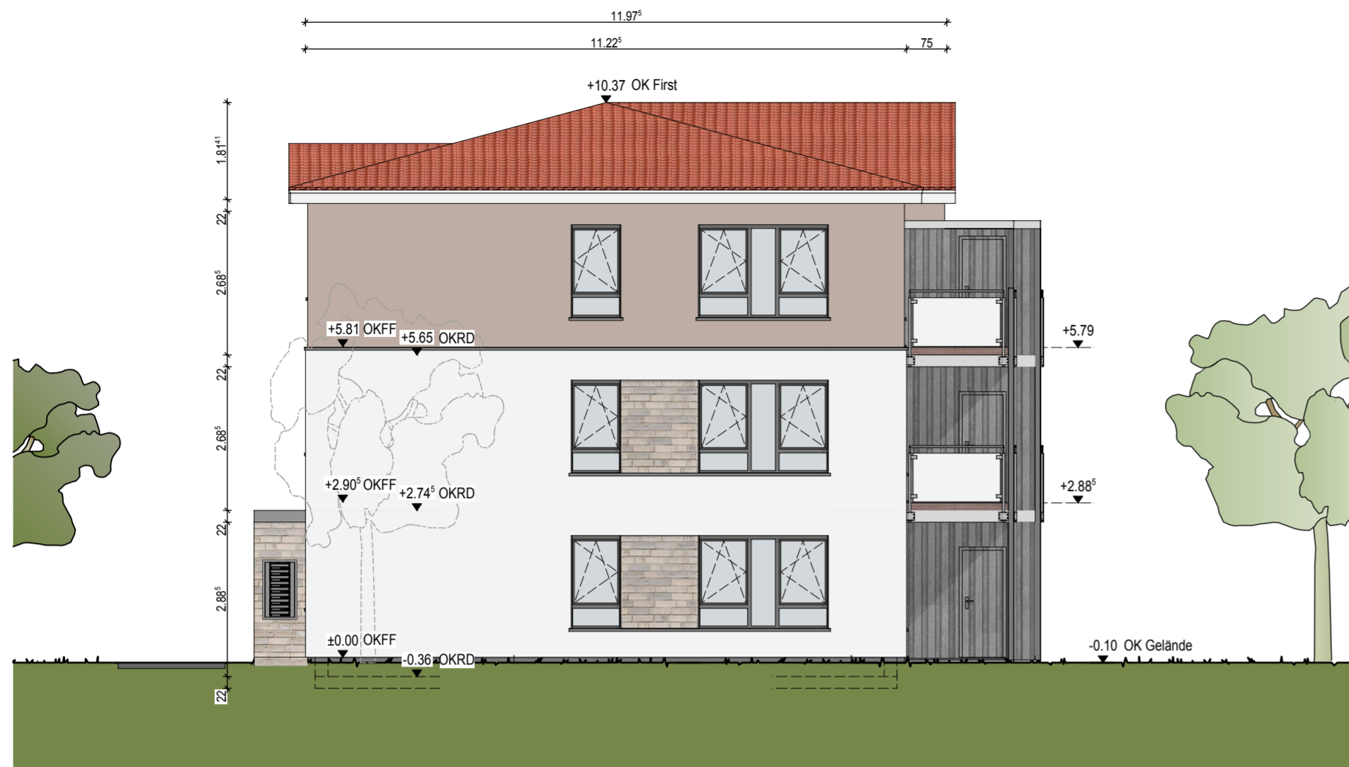
West-Ansicht Haus 4