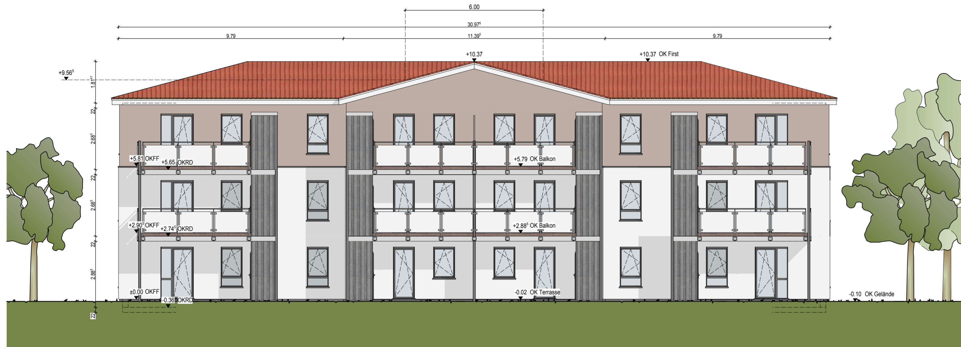
Süd-Ansicht Haus 4